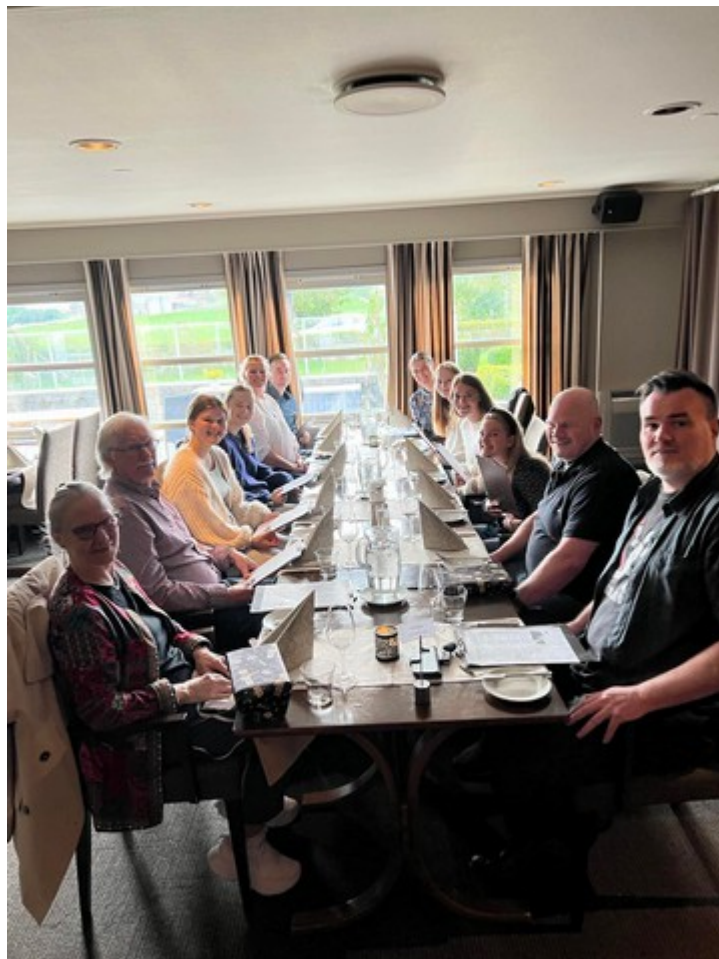
Her er alle sammen.

Dagen etterpå, søndag den 14. reiste vi tilbake til Kongsvinger.