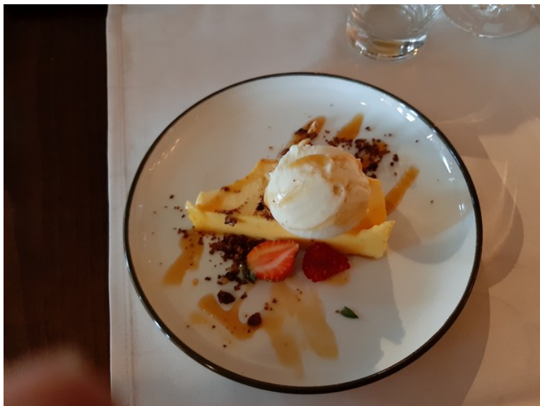
Til dessert hadde vi Karamellpudding med vaniljeis fra Iskremgarden, bringebær, karamellsaus og hasselnøtcrumble.