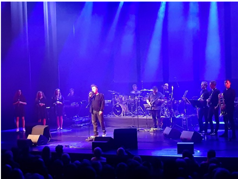
Her er konserten i gang. Den var veldig bra.

Han hadde med seg Philharmonien, som består av 12 musikere.