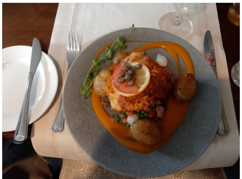
Jeg hadde Schnitzel, hotellets spesial med svineplomme fylt med ost, skinke og ravigottesaus, servert med erter bonne femme og ovnstekte poteter.